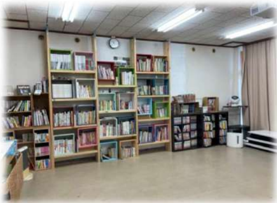
団地集いの場「茶山台としょかん」