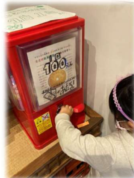
通貨「チロル」新しい仕組み