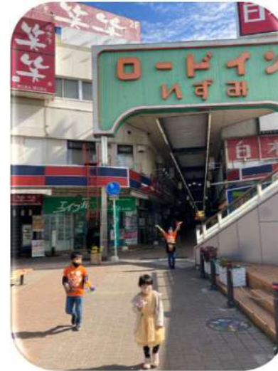
ロードインいずみの中にあります