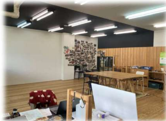
「コノミヤテラス」の集いスペース