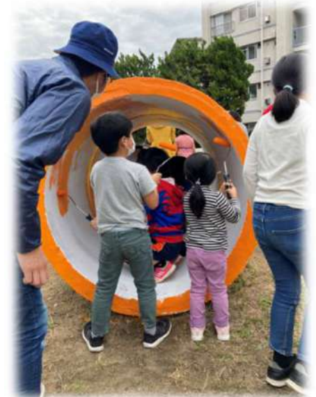
住民主体でペンキ塗り